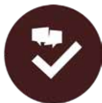
BEVILJAT / FÖRLÄNGT MEDLEMSKAP