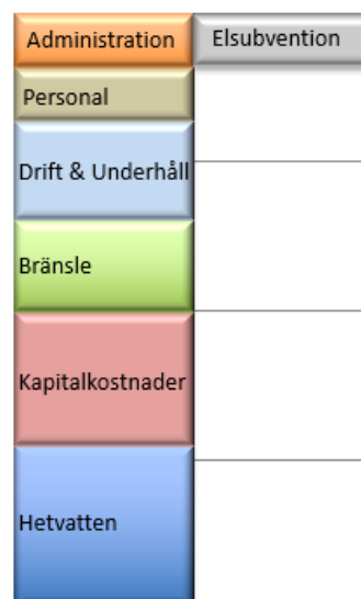
Figur 1. Fördelning av fjärrvärmens totala kostnader (Budget 2022)

Drift och Underhåll: Här visas kostnaderna för drift och underhåll av våra produktions- och distributionsanläggningar inkl. fjärrvärmecentraler och läcklagning.